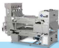
智能履带视觉分选机