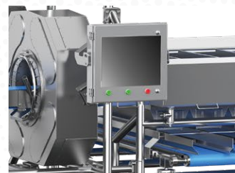
○ 智能触控操作系统