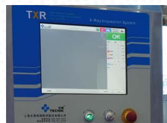
○ 智能触控操作系统